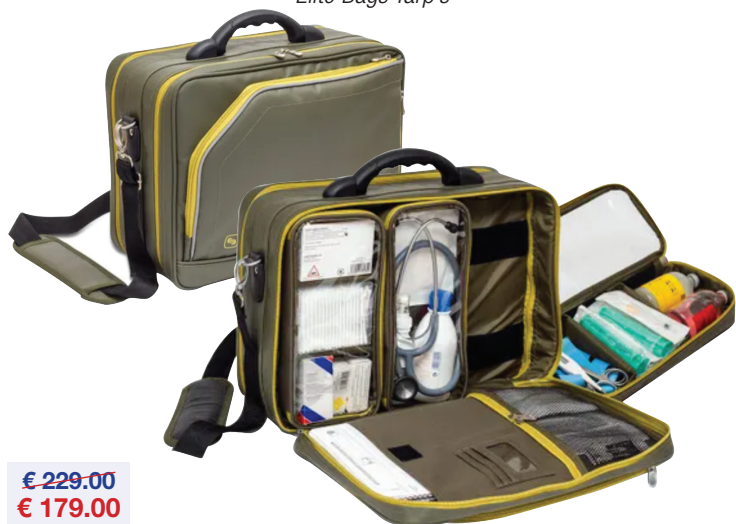
Dokterstas Mallette médicale Elite Bags Tarp's