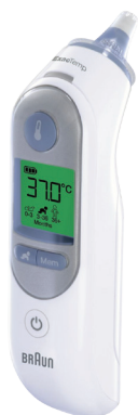
Thermometer met Age Precision Thermomètre avec Age Precision Braun ThermoScan® 7