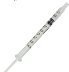
BD Plastipak™ Luer Tuberculine spuit - 1 ml Seringue Tuberculine - 1 ml