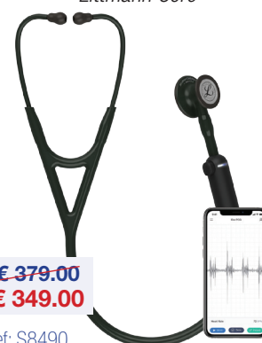
Stethoscoop Stéthoscope Littmann Core