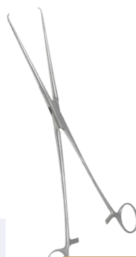
Braun Tenaculum tang Pince Braun Tenaculum