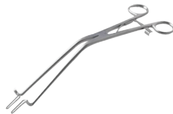
Kogan endocervicaal speculum Spéculum endocervical de Kogan