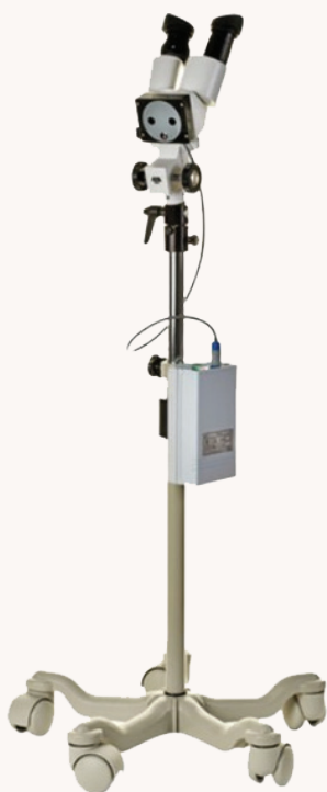
LED colposcoop Colposcope LED Gima Colpy