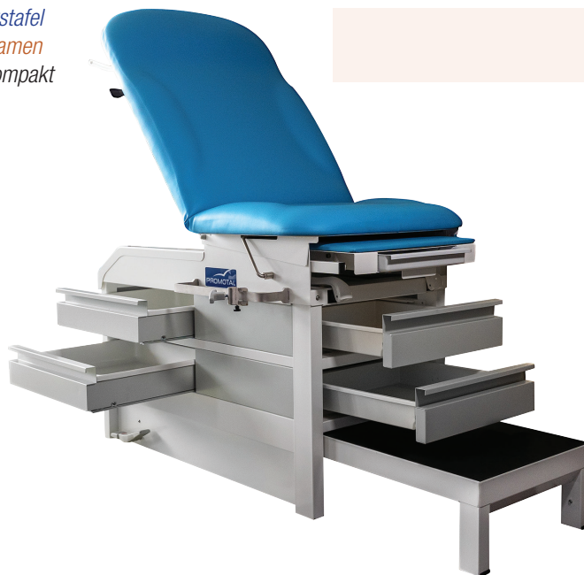
Onderzoekstafel Table d'examen Promotal Kompakt