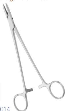
Mayo - Hegar Metalen naaldvoerder Porte-aiguille en métal