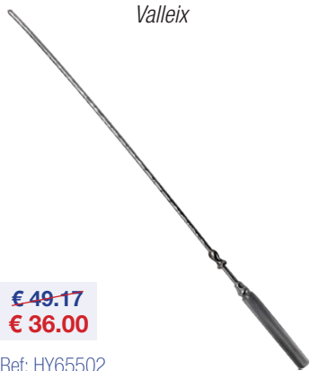
Hysterometer Hystéromètre Valleix