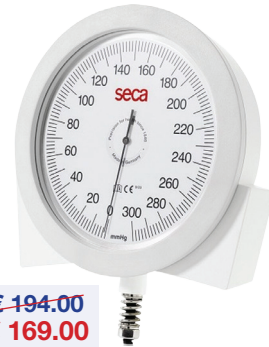
Bloeddrukmeter Tensiomètre Seca b41