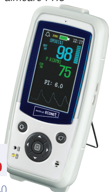
Pulsoximeter Oxymètre de pouls Palmcare PRO