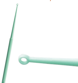
Bionix Safe Ear Microloop curetten curettes Microloop