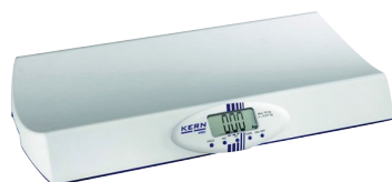
Babyweegschaal Pèse-bébé Kern MBD