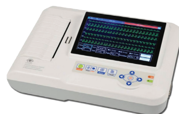
ECG toestel Appareil ECG Contec 600G