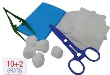
Verbandset Sets de pansement 1050