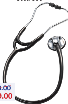
Stethoscoop Stéthoscope Seca S60