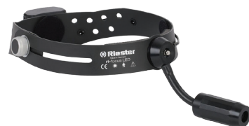
Riester Ri-Focus® LED-koplamp Lampe frontale à LED