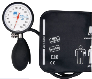
KaWe Mastermed A1 Bloeddrukmeter Tensiomètre