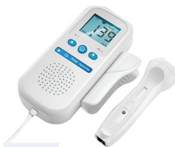
Foetale doppler Doppler foetal MD800