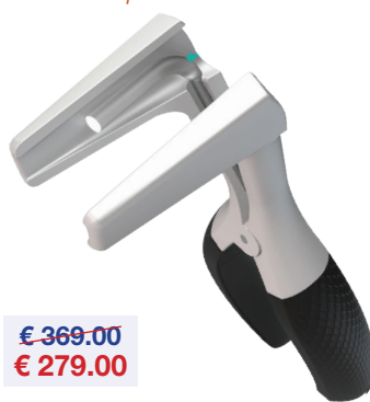
Vision Tech LED neusspeculum Lampe frontale à LED