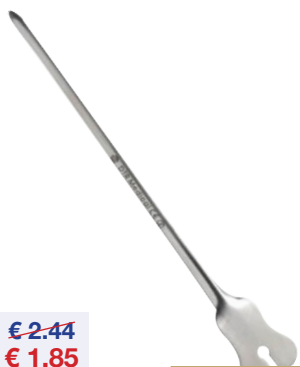
Steriele gleufsonde Sonde à fente stérile