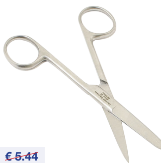
Rechte chirurgische schaar Ciseaux chirurgicaux droits