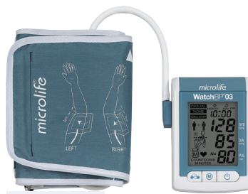
Bloeddrukmeter 24 uur Tensiomètre 24 heures Microlife WatchBP 03