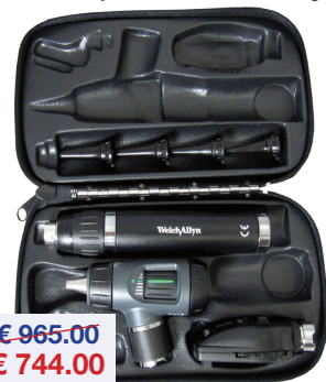
Lithium diagnose set Set de diagnostic au lithium Welch Allyn Macroview Prestige