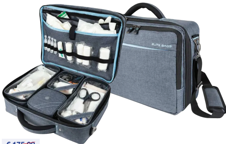
Dokterstas Mallette médicale Elite Bags Street's