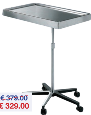
Instrumententafel Table à instruments